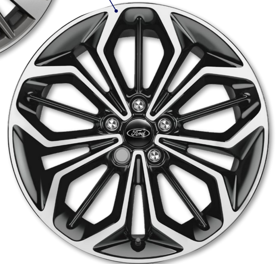
18 inch lichtmetalen velgen, 5x3-spaaks in High Gloss Black/Machined