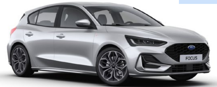
Metaallak Moondust Silver