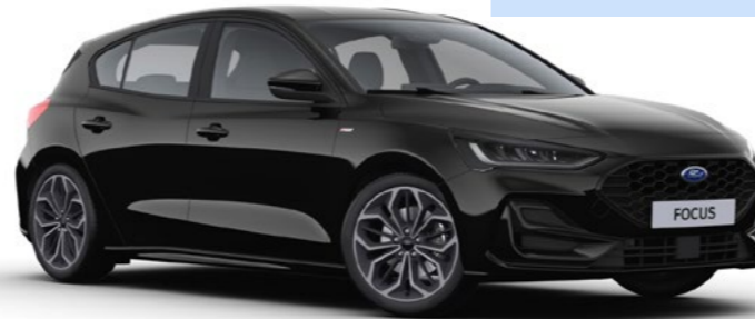
Premium metaallak Agate Black