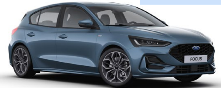
Premium metaallak Chrome Blue